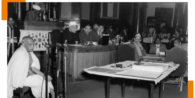
سردار ولپ پاني پٽيل ۲۴ جنوري ۱۹۵۰ ۾ قانون ساز اسيمبلي جي پنهنجي آخري اجلاس ۾.

آئين ساز اسيمبليءَ اپنايو قومي جينڊو 22 جولاءِ 1947 تي قومي ترانو ۽ قومي گيت 24 جنوري 1950 تي