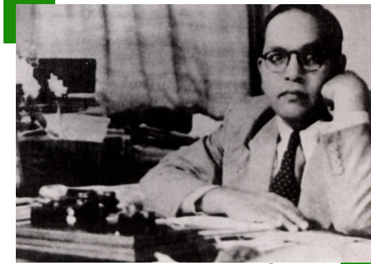
ڊاڪٽر بي. آر. امبيڊڪر جو تصويري خاڪو