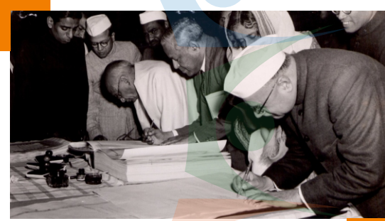
مرڪزي ڪابينا جا ميمبر بھارت جي سيدان تي صحيح ڪندي. راجڪماري امرت ڪور، ڊاڪٽر جان مٿائي ۽ سردار ولپ باني پٽيل تصوير ۾ نظر اچي رهيا آهن.

هندستان جو آئين 26 نومبر 1949 تي اپنايو ويو. اهو 26 جنوري 1950 تي نافذالعمل ٿيو. ان ڏينهن اسيمبلي پنهنجو هندستان جي عارضي پاليامينٽ جو وجود ختم ڪري ڇڏيو جيستائين 1952 ۾ نئين پارليامينٽ تشڪيل نه ڏني وئي قانون جي مسودي تي غور ڪندي اسيمبليءَ پيش ڪيل، ڪُل 7635 ترميمن مان 2473 ترميمن کي منتقل، تباهه خيال منظوري ڏني حقيقت ۾ 299 ميمبرن مان، 284 ميمبرن مسودي تي صحيح ڪئي