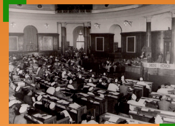
قانون ساز اسيمبلي جو اجلاس، ڊسمبر 1946

آگسٽ 1947 تي قانون ساز اسيمبلي ڊاڪٽر بي آر امبيڊڪر جي زير صدارت آئين جو مسودو تيار ڪرڻ لاءِ هڪ مسوده ڪميٽي تشڪيل ڏني 29