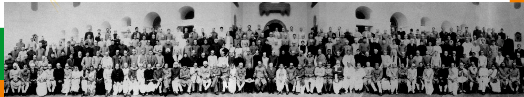
قانون ساز اسيمبلي جي اراڪن جو گروپ فوٽو 1950

فن خطاطي جي ماهر ايس ايڇ. پريم بھاري نارائن، اڪيلي سر مسودو لکيو. ان ڪم کي مڪمل ڪرڻ لاءِ هن کي 6 مهينا لڳا ۽ ان ڪم عيوض هن ڪاتي رقم نه ورتي.