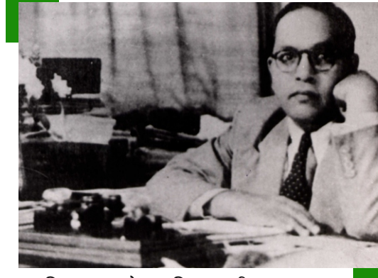
डः बि.आर. आम्बेदकारनि सावगारि

“संबिजिरा उकिलफोरनिल’ फोरमान बिलाड नडा, बियो जिजनि मोनसे रहा आरो बिनि जिवमाया अरायबो जुग जुगनि जिवमा जाना थानांगाना” डः बि.आर. आम्बेदकार