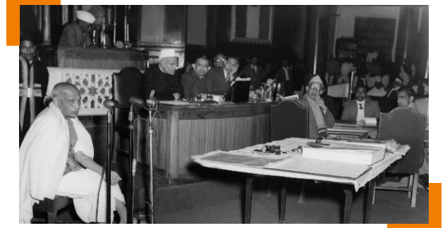
24 जानुवारी 1950आव संबिजिर आइन आफादनि जुथुम्मा जोबथा जुथुम्मायाव सदरि भल्लबभाइ पेटेल।