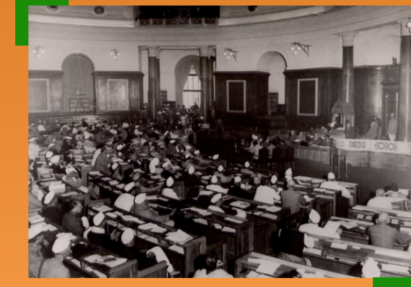
संबिजिर आइन आफादनि जुथुम्मा, डिसेम्बर 1946

29 आगस्ट 1947आव संबिजिर आइन आफाद डः बि.आर. आम्बेदकारनि मासि सामलायनायाव खसरा संबिजिर लिरनो थाखाय खसरा आफाद दानानै होयो।