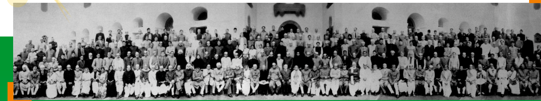
संविधान सभा के सदस्यों की सामूहिक तस्वीर, 1950

श्री प्रेम बिहारी नारायण रायजादा, केलिग्राफिक आरिमुनि सासे फोरोंगिरिआ, गाव हारसिडैने संबिजिरखौ आखाइजों लिरदोंमोन। बे हाबाखौ फोजोवनो बिथानो 6 दान नांदोंमोन आरो बिथाडा बिनि थाखाय गरसेबो रं लायाखै।