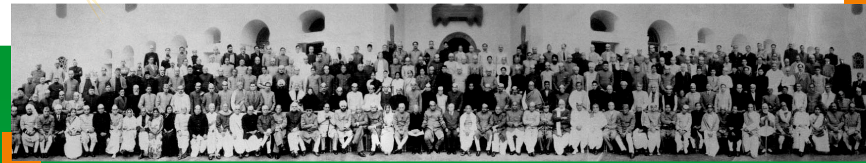
संविधान सभा के सदस्यों की सामूहिक तस्वीर, 1950