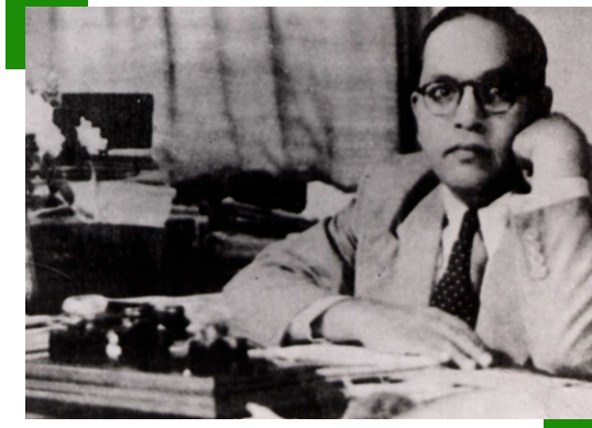
डा. बी.आर. अम्बेडकर हुंदी प्रतिमा