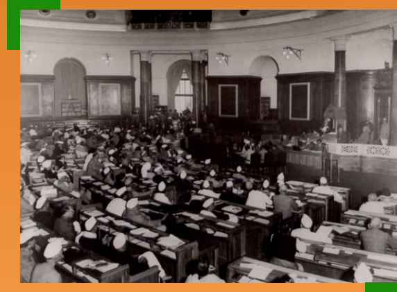
संविजिर आइन आफादनि जुथुम्मा, दिसम्बर 1946

29 अगस्त 1947 गी संविधान सभा नै संविधान दा मसौदा तैयार करने लेई डा. बी.आर. अम्बेडकर हुंदी अध्यक्षता च मसौदा कमेटी दा गठन कीता।