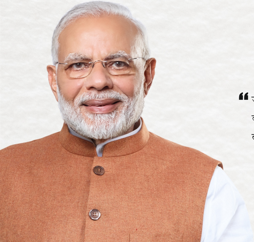
नरेन्द्र मोदी प्रधानमंत्री

“जेगर संविधान, छडा सरकार लेई अनुसरण करने दा दस्तावेज गै बने दा रौहदा ऐ, तां लोकतंत्र मजबूत नेई होग, इसकारियै एहदे जमीनी सतह तगर पुज्जने दी लोड ऐ”