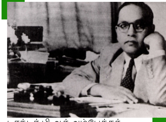
டாக்டர் பி.ஆர்.அம்பேத்கர் புகைப்படம்