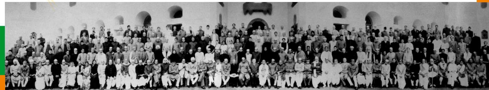
இந்திய அரசமைப்புச் சட்ட உறுப்பினர் குழுவின் புகைப்படம் 1950

மொத்தமுள்ள 299 உறுப்பினர்களில், 284 உறுப்பினர்கள்தான் அரசியல் சாசனத்தில் கையெழுத்திட்டுள்ளனர்.