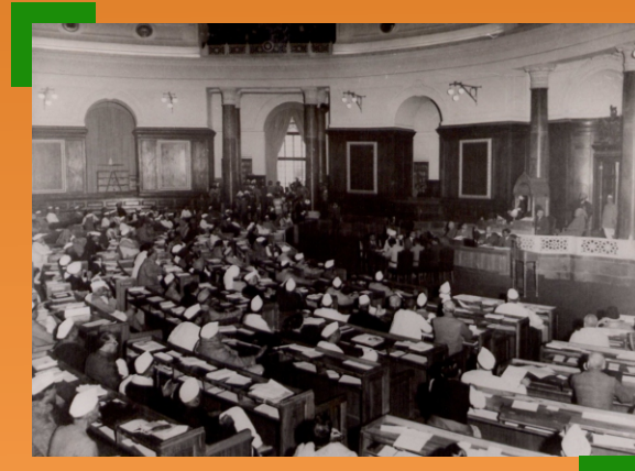
அரசியல் சட்ட நிர்ணய சபைக் கூட்டம், டிசம்பர் 1946

அரசியல் சட்டத்தின் நகல் தயாரிப்புக்கு டாக்டர் பி.ஆர்.அம்பேத்கர் தலைமையின் கீழ் நகல் உருவாக்கக் குழுவின் அரசியல் சட்ட நிர்ணயசபை 1947 ஆகஸ்ட் 29 அன்று நியமித்தது.