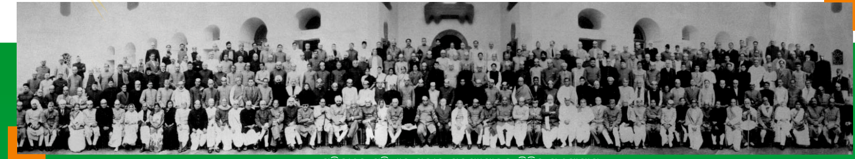
1950 ମସିହାରେ ସମ୍ବିଧାନ ସଭାର ସଦସ୍ୟମାନଙ୍କ ମିଳିତ ଫଟୋଗ୍ରାଫି

1947 ମସିହା ଜୁଲାଇ 22 ତାରିଖ ଦିନ ସମ୍ବିଧାନ ସଭା ଜାତୀୟ ପତାକା ପ୍ରସ୍ତାବକୁ ଗୃହୀତ କରିଥିଲା ଏବଂ ରାଷ୍ଟ୍ରୀୟ ଗାନ ଓ ଜାତୀୟ ସଂଗୀତ ପ୍ରସ୍ତାବ 1950 ମସିହା ଜାନୁଆରୀ 24 ତାରିଖ ଦିନ ଗୃହୀତ ହୋଇଥିଲା । ଆଧୁନିକ ଭାରତୀୟ ଚିତ୍ରକଳାର ପ୍ରଖ୍ୟାତ ଚିତ୍ରକର ଶ୍ରୀ ନନ୍ଦଲାଲ ବୋଷ ସମ୍ବିଧାନର ପ୍ରତିଟି ପୃଷ୍ଠାର ବର୍ତ୍ତନ ଡିଜାଇନ୍ ପ୍ରସ୍ତୁତ କରିଥିଲେ ଏବଂ ସେଥିରେ ବିଭିନ୍ନ ପ୍ରକାର ଚିତ୍ରକଳା ଆଙ୍କି ଥିଲେ । ଶ୍ରୀ ପ୍ରେମ ବିହାରୀ ନାରାୟଣ ରାଠ୍ଟି, ଯିଏକି କାଳିଗ୍ରାଫି କଳାର ଜଣେ ପ୍ରଖ୍ୟାତ ଶିଳ୍ପୀ ଥିଲେ, ଏକାକୀ ଅଶେଷ ଶ୍ରମ ସ୍ୱୀକାର ପୂର୍ବକ ନିଜ ହାତରେ ସମଗ୍ର ସମ୍ବିଧାନକୁ ଲେଖିଥିଲେ । ଏଥିପାଇଁ ସେ ମୋଟ ଛଅମାସ ସମୟ ନେଇଥିଲେ ଏବଂ ତାଙ୍କର ଏହି ଅକ୍ଳାନ୍ତ ଶ୍ରମ ପାଇଁ ସେ କୌଣସି ପାରିଶ୍ରମିକ ଦାବି କରିନଥିଲେ ।