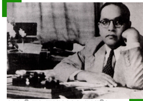
ଡକ୍ଟର ବି ଆର ଆୟେଦକରଙ୍କ ଫଟୋଗ୍ରାଫି

“ ଆମ ସମ୍ବିଧାନ କେବଳ ଆଇନଜ୍ଞମାନଙ୍କର ଏକ ନଥି ଦୁହେଁ, ଏହା ଜୀବନର ଏକ ବାହକ ଓ ଏହାର ଆତ୍ମା ସଦାସର୍ବଦା ସମୟର ସ୍ରୋତକୁ ସୂଚୀତ କରେ । ” ଡଃ ବି. ଆର. ଆୟେଦକର