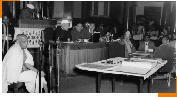
1950 ମସିହା ଜାନୁଆରୀ 24 ତାରିଖ ଦିନ ସମ୍ବିଧାନ ସଭାର ଚୂଡ଼ାନ୍ତ ଅଧିବେଶନରେ ସର୍ଦ୍ଦାର ବଲ୍ଲଭଭାଇ ପଟେଲ