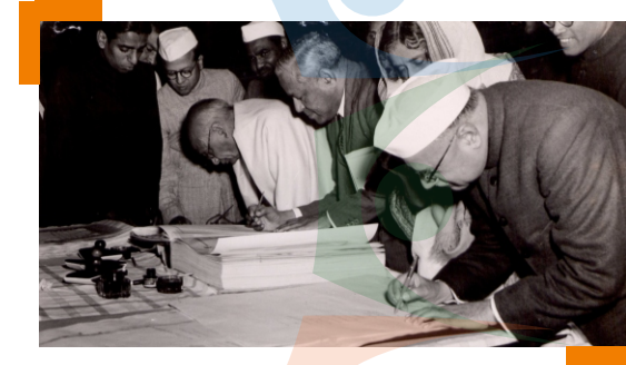
କେନ୍ଦ୍ର କ୍ୟାବିନେଟର ସଦସ୍ୟବୃନ୍ଦ ଭାରତର ସମ୍ବିଧାନରେ ସେମାନଙ୍କର ସ୍ୱାକ୍ଷର କରୁଛନ୍ତି । ରାଜକୁମାରୀ ଅମ୍ବିତ କୌର, ଡକ୍ଟର ଜନ ମାଆଇ ଏବଂ ସର୍ଦ୍ଦାର ବଲ୍ଲଭଭାଇ ପଟେଲ ଫଟୋରେ ଦୃଶ୍ୟମାନ ।

1949 ମସିହା ନଭେମ୍ବର 26 ତାରିଖ ଦିନ ଭାରତର ସମ୍ବିଧାନ ଗୃହୀତ ହୋଇଥିଲା । 1950 ମସିହା ଜାନୁଆରୀ 26 ତାରିଖ ୦୧ରୁ ଏହା ବଳବତ୍ତର ହୋଇଥିଲା । ସେହି ଦିନଠାରୁ ସମ୍ବିଧାନ ସଭା ରଦ୍ଦ ହୋଇଥିଲା ଏବଂ 1952 ମସିହାରେ ନୂତନ ସଂସଦ ଗଠିତ ହେବା ପର୍ଯ୍ୟନ୍ତ ଏହାକୁ ଭାରତର ଅସ୍ଥାୟୀ ସଂସଦ ରୂପେ ରୂପାନ୍ତରୀତ କରାଯାଇଥିଲା । ଟିଠା ସମ୍ବିଧାନ ସଂପର୍କରେ ଆଲୋଚନା କରାଯିବା ସକାଶେ, ସମ୍ବିଧାନ ସଭାରେ ମୋଟ ମୋଟ 7635ଟି ସଂଶୋଧନ ପ୍ରସ୍ତାବ ଆଗତ ହୋଇଥିଲା, ସେଥି ମଧ୍ୟରୁ 2473ଟି ପ୍ରସ୍ତାବର ଆଲୋଚନା ଏବଂ ସମାଧାନ କରାଯାଇଥିଲା ।